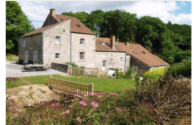
Ancien moulin restauré